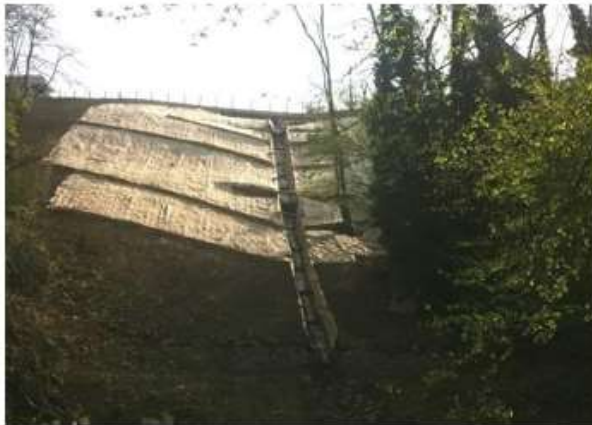
Lavori di sistemazione e consolidamento versante in frana in Loc. Campo d'Ania, comune di Coreglia Antelminelli (LU) Unione Comuni M.V. Serchio - 2012