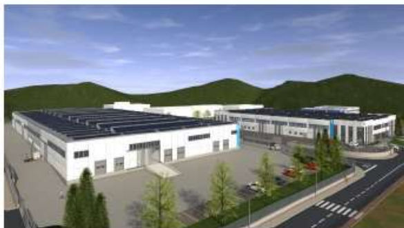
PCMC Spa – complesso industriale Rio del Chitarino Vista complessiva stabilimenti - Anno 2016