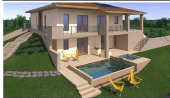
Abitazione privata nel Comune di Barga Anno 2016