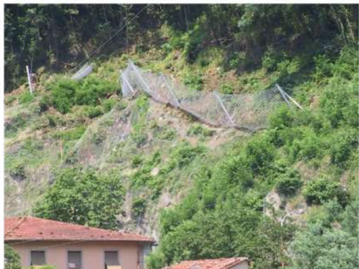
Comune di Bagni di Lucca (LU) - Opere di Consolidamento versante sovrastante l'abitato in via Umberto II a seguito dell'evento alluvionale del Novembre 2000 – Fine Lavori e Fase Esecutiva