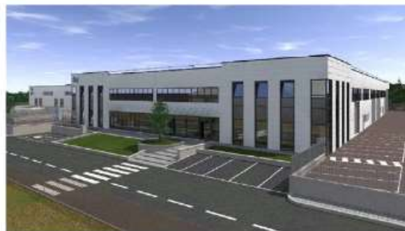
PCMC Spa – complesso industriale Rio del Chitarino Vista ingresso principale Stab.C1 - Anno 2016