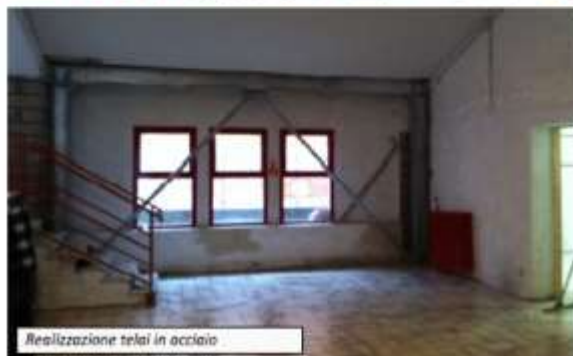
Realizzazione telai in acciaio