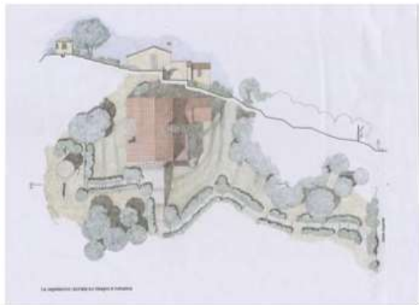
Restauro e risanamento conservativo da eseguirsi ai fabbricati posti in località Semaforo all'interno del parco della Maremma