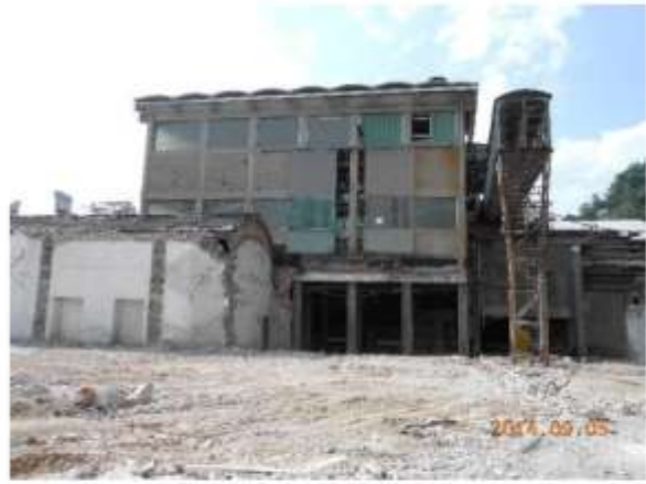
Carlira Smurfit Kappa – Stab. Di Ponte all'Ania, Barga (LU) Cogenerazione Turbogas 13MW (termine demolizioni) Anno 2015