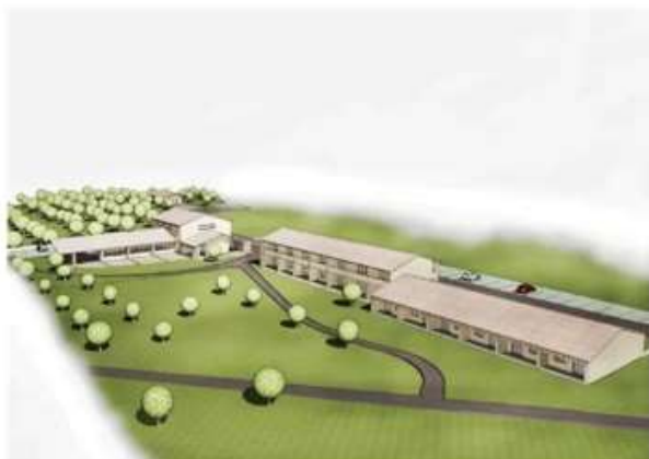
Ristrutturazione di fabbricato per lo Studio di fattibilità per realizzazione di 8 unità immobiliari nel complesso turistico in Talamone (GR)- 2007