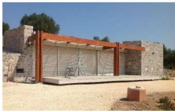
Realizzazione di fabbricato per civile abitazione all'interno del Parco Regionale della Maremma Fine Lavori