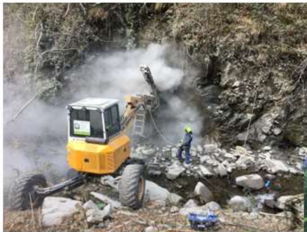
Realizzazione briglie selettive debris flow su torrenti Finocchini, Cuccagna e Fornacetta - Comune Fabbriche di Vergemoli (LU) Consorzio di Bonifica 1 -Toscana Nord - 2018