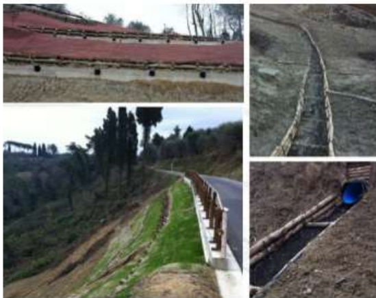
Lavori di sistemazione e consolidamento versante in Podere Casanova, comune di Palaia (PI) - 2009