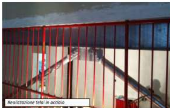
Realizzazione telai in acciaio