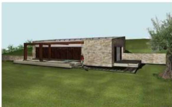
Realizzazione di fabbricato per civile abitazione all'interno del Parco Regionale della Maremma Anno 2012