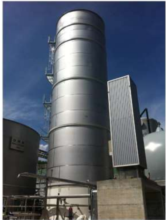
Estensione dell'esistente impianto di depurazione delle acque reflue con pretrattamento anaerobico e linea di raccolta e desolforazione del biogas presso lo Stab. Smurfit Kappa di Ponte all'Ania (LU) - 2011.