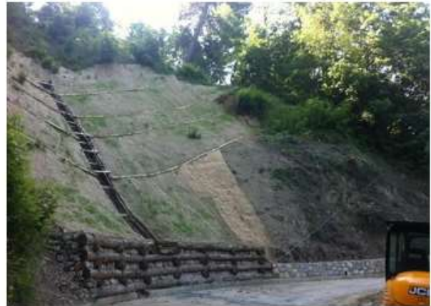
Lavori di sistemazione e consolidamento versante in frana in Loc. Fiantone, comune di Galliciano (LU) - 2014