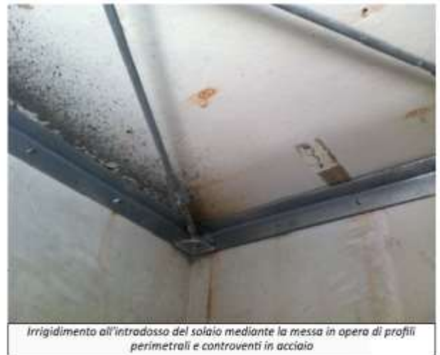
Irrigidimento all'intradosso del solaio mediante la messa in opera di profili perimetrali e controventi in acciaio