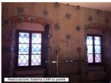
Comune di Piteglio (PT) Progetto di adeguamento sismico Palazzo Comunale Applicazione metodo CAM (Cuciture Attive Murature)