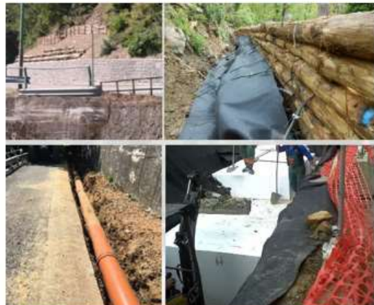
Lavori di Messa in sicurezza strade comunali di Retignano e Terinca Comune di Stazzema (LU) - 2016