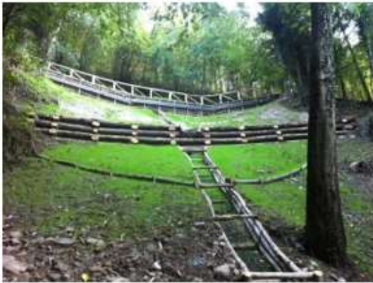
Lavori di sistemazione consolidamento versanti in frana loc. Fomioni e loc. Tiglio comune di Barga (LU) - 2011