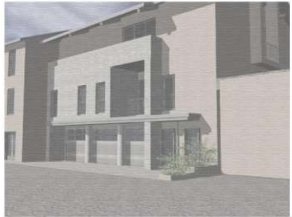
Il "Maggiociondolo" – Demolizione e ricostruzione di fabbricato per sociale e servizi – Riolunato (MO) Foto della fase di demolizione del complesso e immagine render del progetto