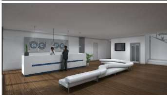
PCMC Spa – complesso industriale Rio del Chitarino Studio reception stab. C1 - Anno 2016