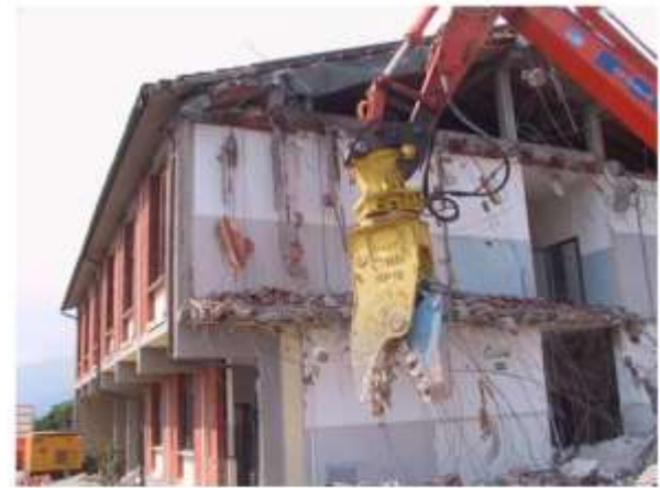
Comune di Piteglio (PT) - Lavori di adeguamento sismico e consolidamento versante della scuola materna ed elementare del Capoluogo – 1° lotto funzionale – Fase Esecutiva