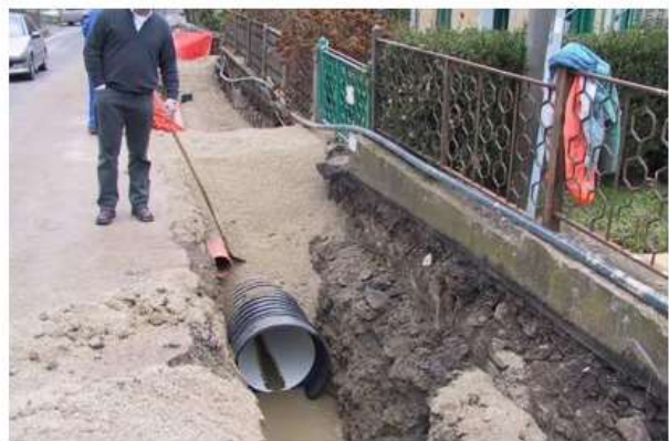
Comune di San Marcello Pistoiese (PT) - Interventi di completamento e rifacimento di tratti di fognature comunali Costruzione del nuovo collettore fognario di Maresca - 2004