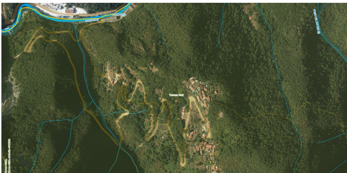
Canale derivante dal Canalone di Gallena