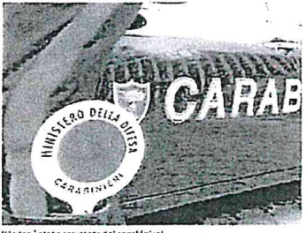
Il ladro è stato arrestato dai carabinieri

ma quando ci ha ricevuto, la borsa è rimasta accanto che si è ricongiunta del denaro e la sua dritta era appiombata. Il ladro però, un italiano senza una dimostrazione con il colore dell'ordine, non ha messo conto che il nostro, essendo un contadino della zona, si tiene in costante allenamento per la scioltezza delle Contrade. Con l'auto siamo andati a cercarlo via via delle Contrade davanti alla Croce Bianca di Casaccia, senza spinti sono arrivati al punto di arrivo e spinto a terra, recuperando il malloppo e consegnandolo al cittadino che infine senza aver sentito parlare del fuorilegge.