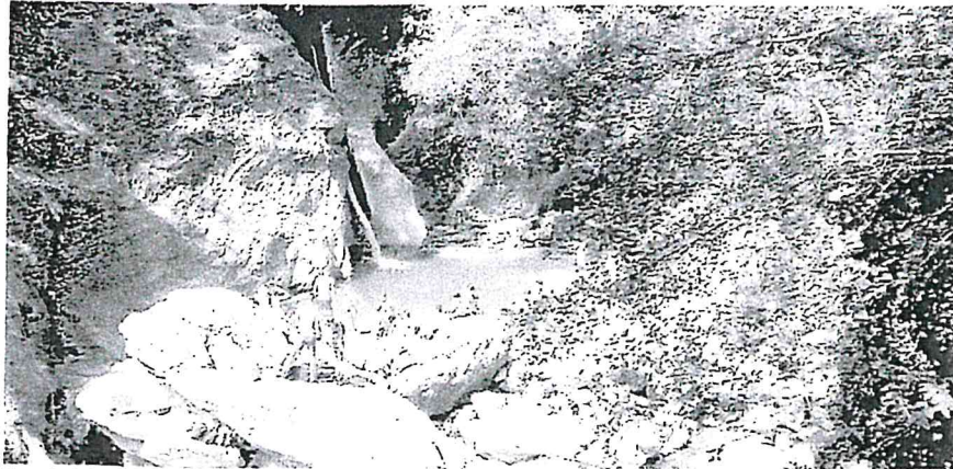
L'area naturale della Desiata