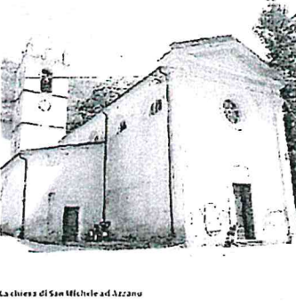
Chiesa di San Michele ad Azzano

Lunedì prossimo dalle 9 alle 13,00 l'energia elettrica interrotta a Stazzema per lavori alla linea. Le vie interessate sono via della chiesa dal numero civico 10, via della chiesa dal 14, via della Chiesa, via Volpato, via del pozzo, via Salita della chiesa e località Vallavento. Durante i lavori l'energia elettrica sarà mantenuta, come viene tuttavia, per questo motivo, per questo motivo, per questo motivo.