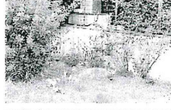
Dalla collina e sceso a Capozzano Pianoro ma quando si è trovato nel traffico ha cercato rifugio in un giardino in via Balara. Il cerbiatto è stato avvistato in un giardino di Capozzano che ha consentito agli volontari di Vega Secchi di farlo ripartire nel bosco.