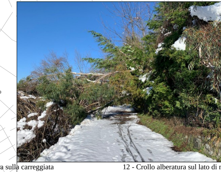
12 - Crollo alberatura sul lato di monte e invasione della carreggiata