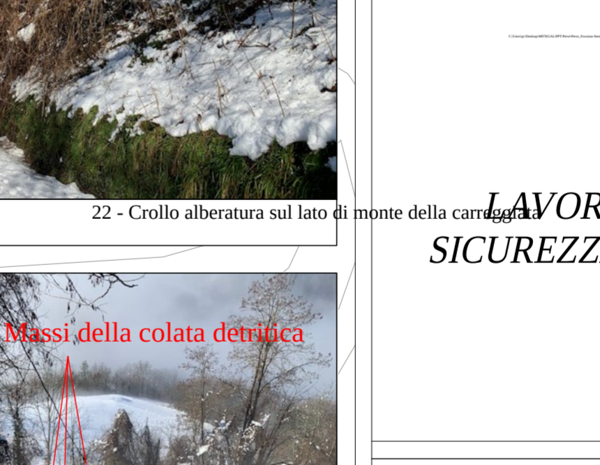
22 - Crollo alberatura sul lato di monte della carreggiata