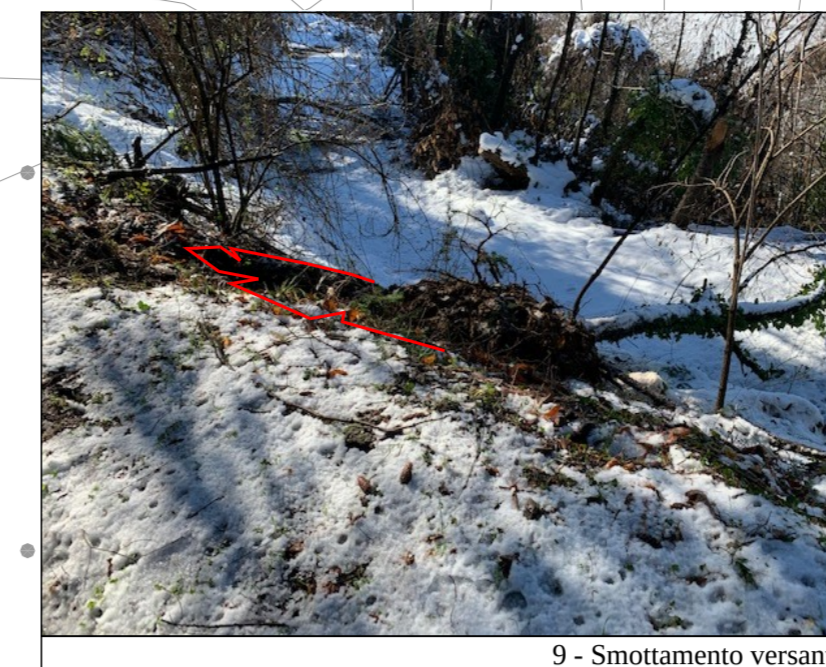
9 - Smottamento versante di valle della carreggiata