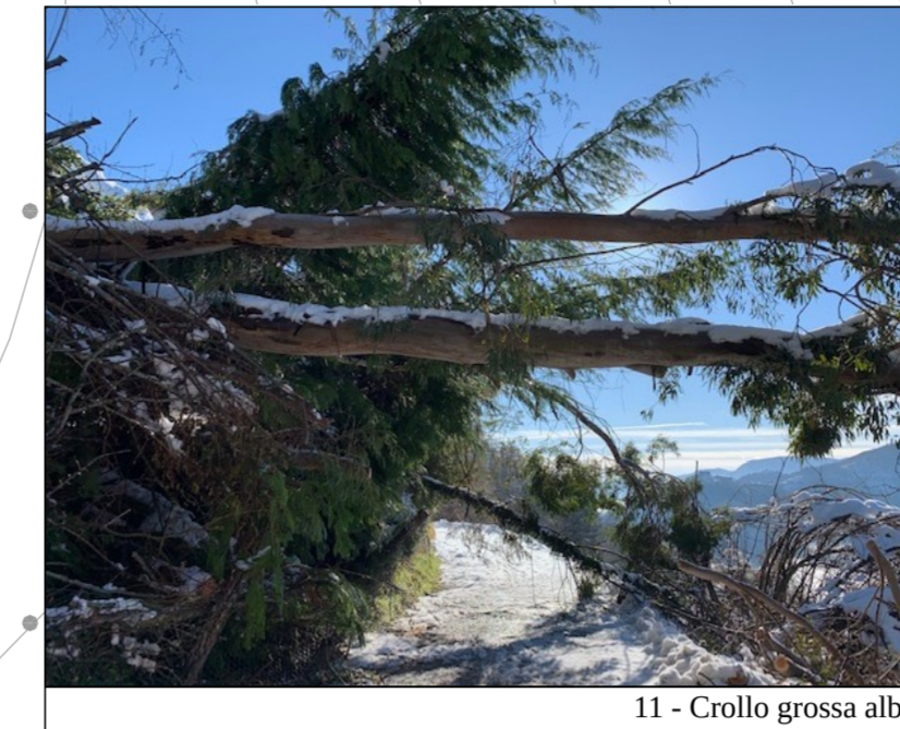
11 - Crollo grossa alberatura sulla carreggiata