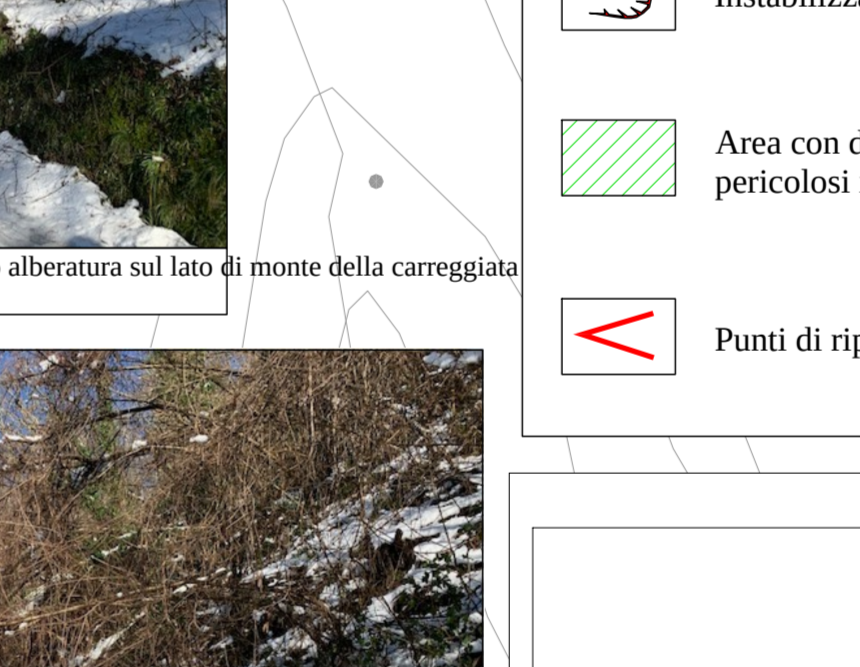
20 - Crollo alberatura sul lato di monte della carreggiata