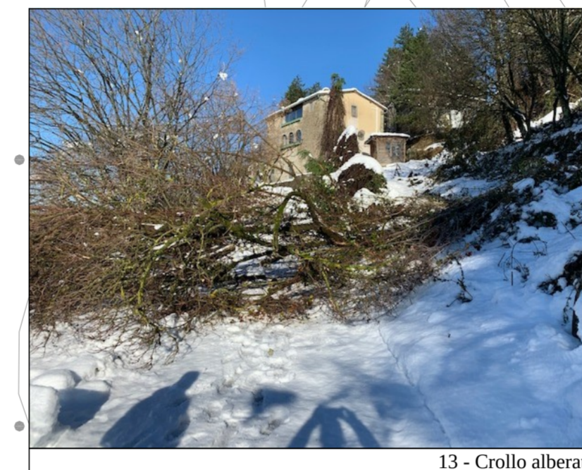
13 - Crollo alberatura sulla carreggiata