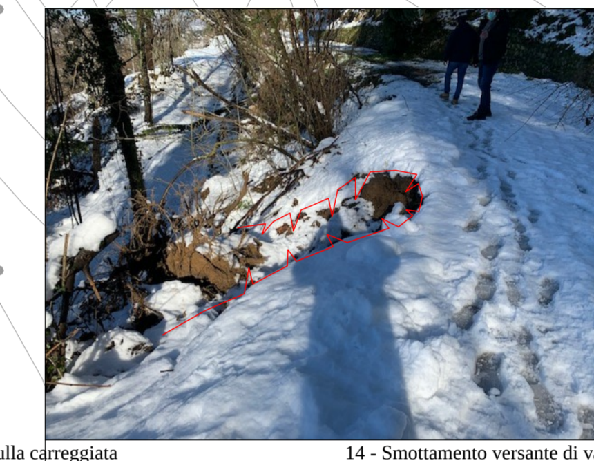
14 - Smottamento versante di valle con perdita di porzione della carreggiata