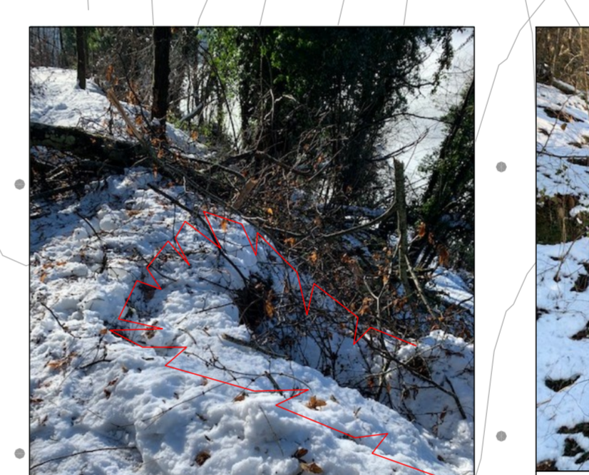
15 - Smottamento versante di valle con perdita di porzione della carreggiata