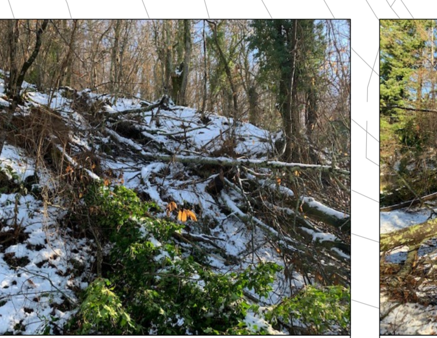
16 - Crollo alberatura sul lato di monte della carreggiata