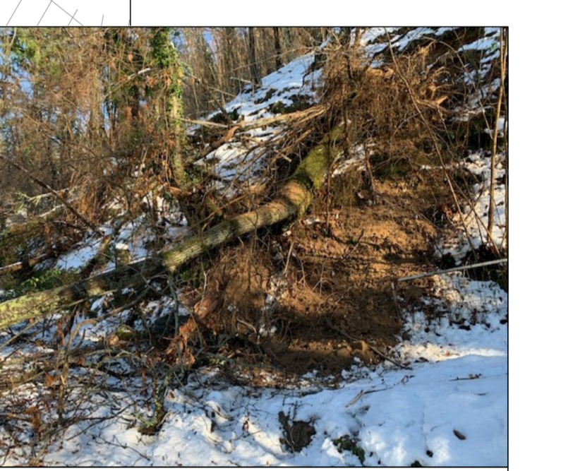
17 - Crollo alberatura sul lato di monte della carreggiata