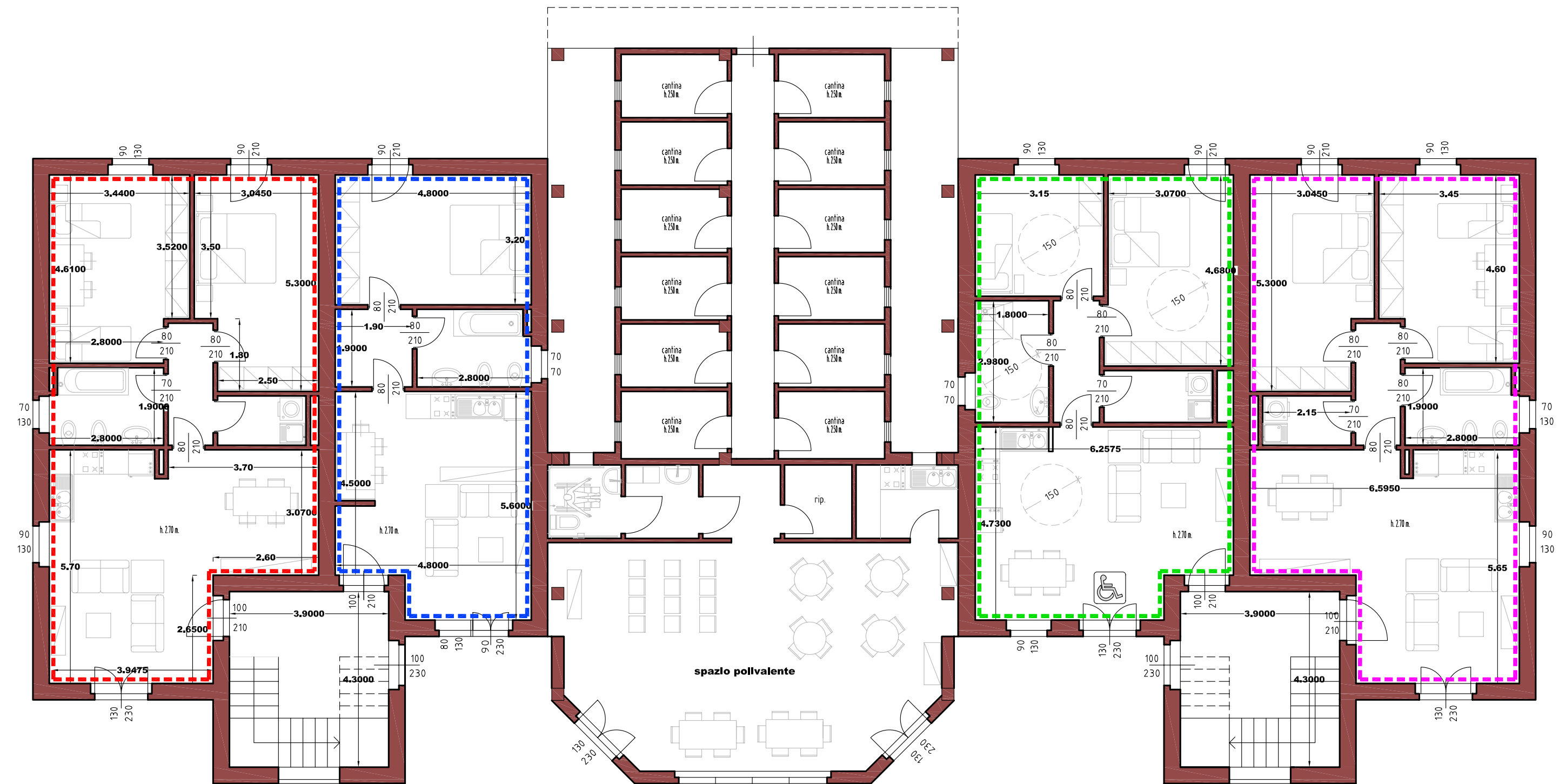
PIANTA PIANO TERRA SCALA 1:100