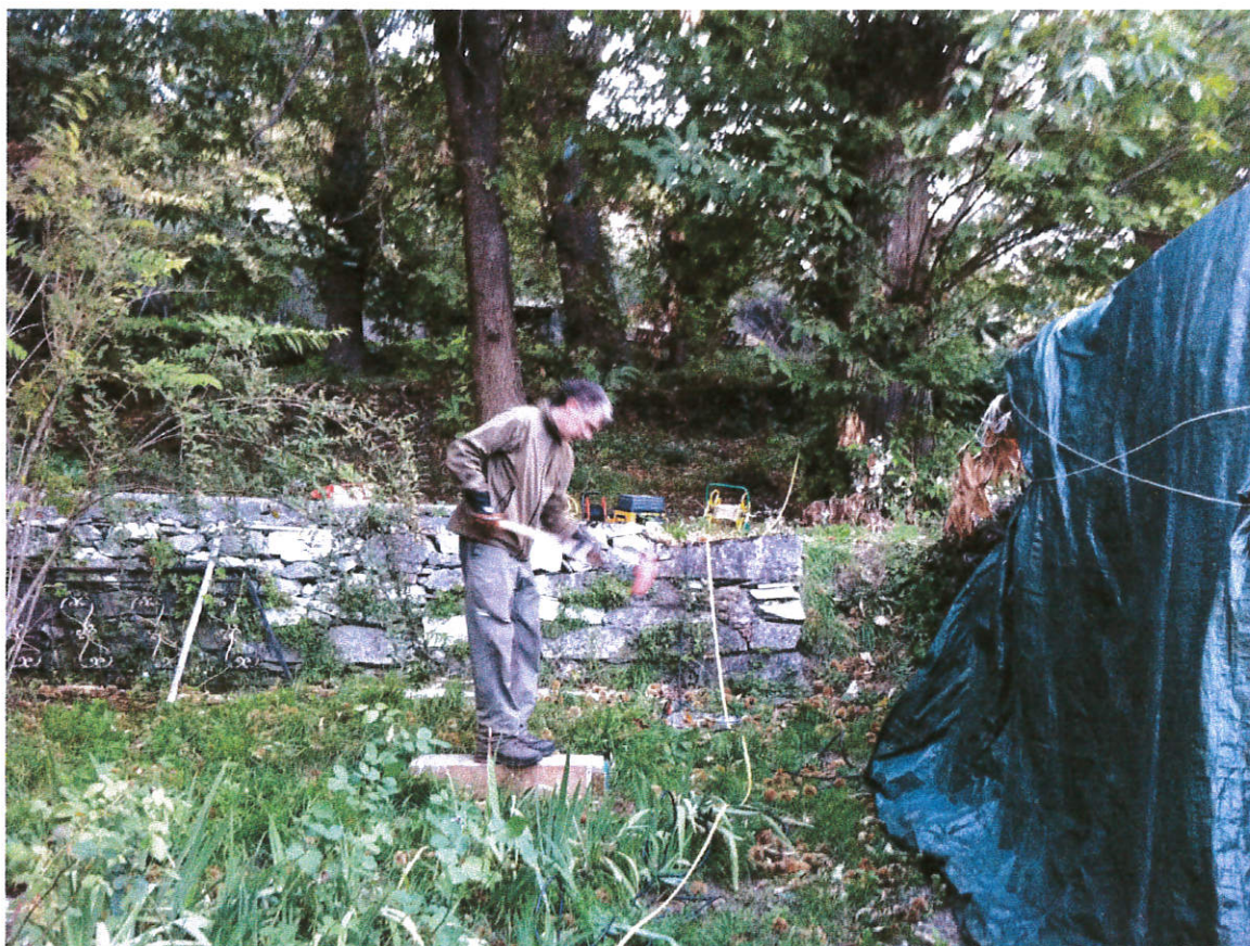
Foto 1 Fasi di esecuzione dello stendimento sismico, eseguito ortogonalmente alle curve di livello.