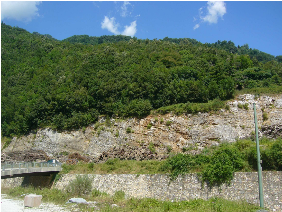
Foto 1 Vista dalla strada Comunale per Cardoso, parte bassa PIP