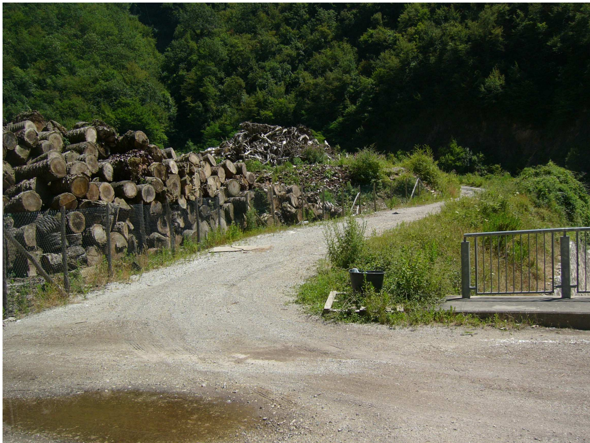
Foto 10 Strada che costeggia il torrente Cardoso a nord