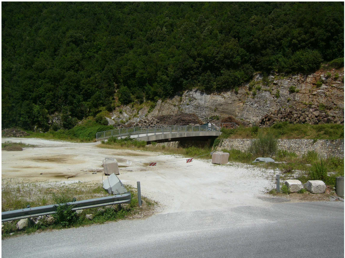
Foto 8 Vista ingresso da Via Comunale per Cardoso