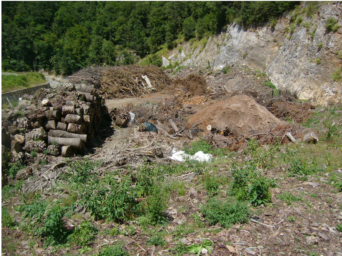
Foto 7 Vista dell'area dove sarà realizzata la piattaforma per lo stoccaggio del cippato