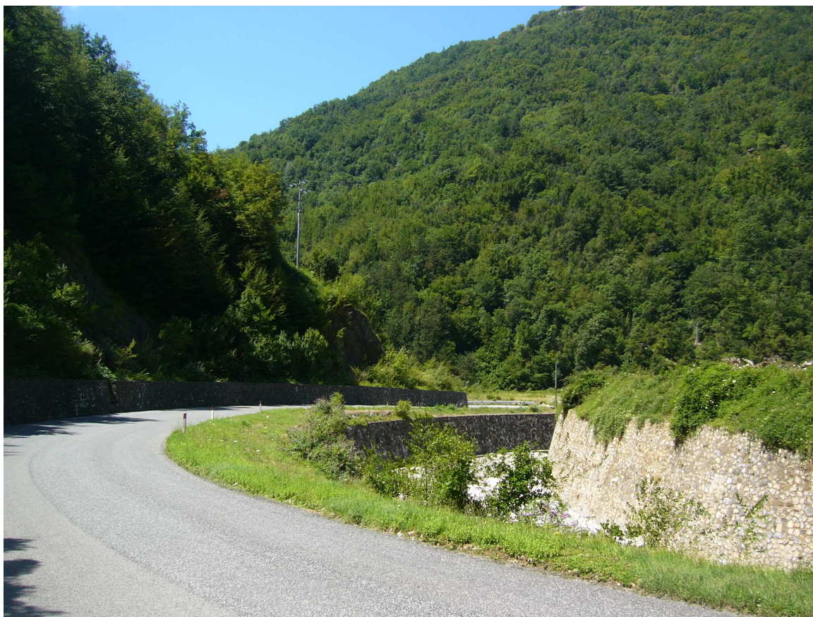
Foto 5 Vista del Torrente Cardoso verso valle