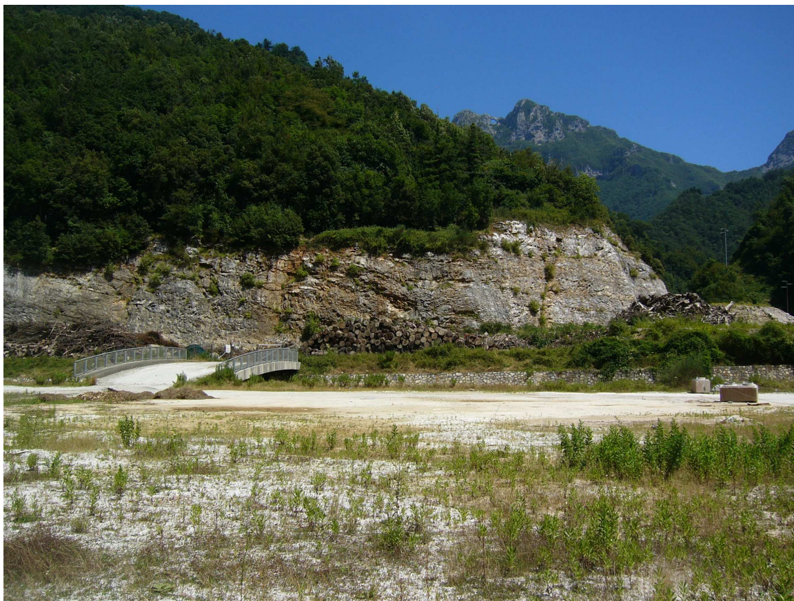
Foto 6 Vista complessiva dell'area PIP con ponte sul torrente Cardoso