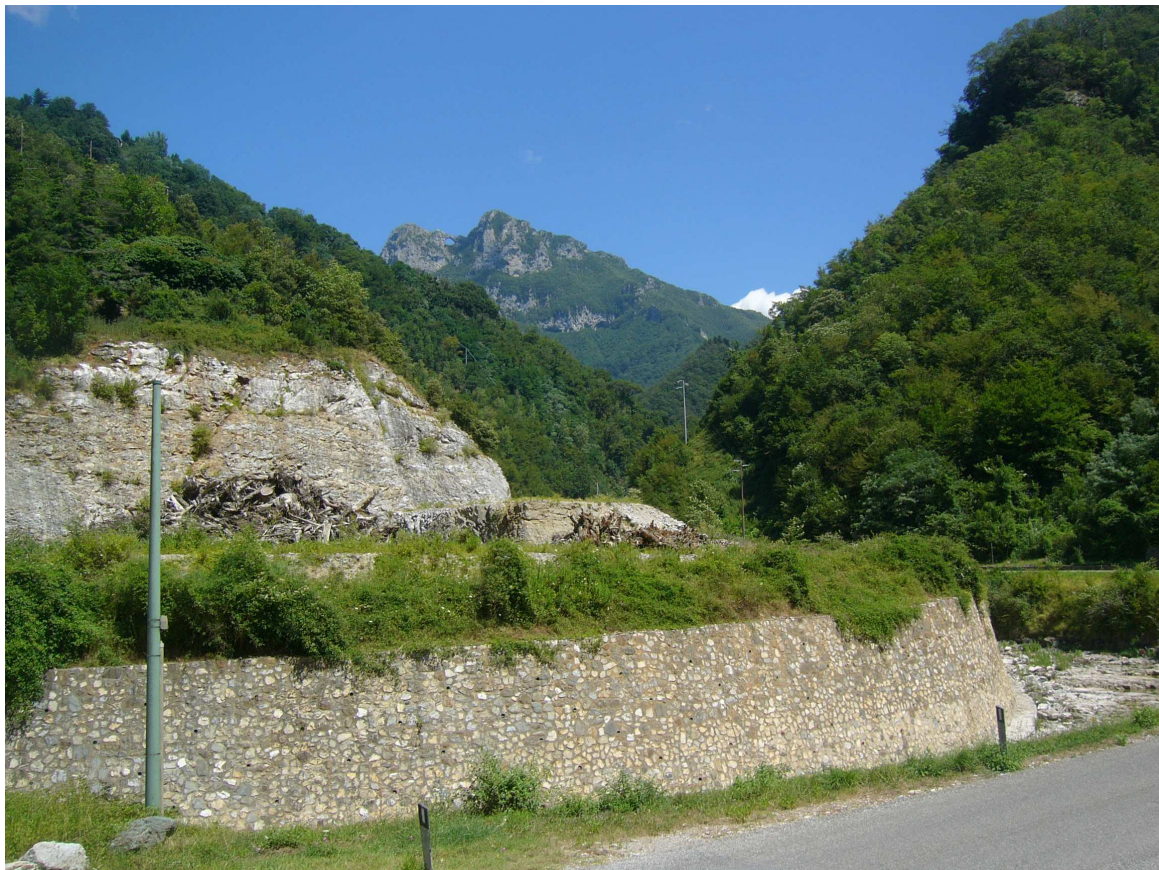
Foto 2 Vista dalla strada Comunale per Cardoso, parte alta PIP