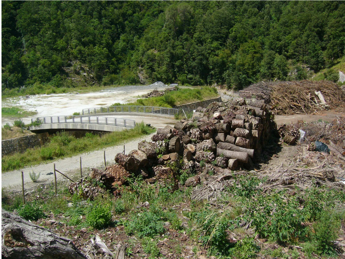
Foto 3 Vista da sopra il terrazzamento a monte dell'area PIP