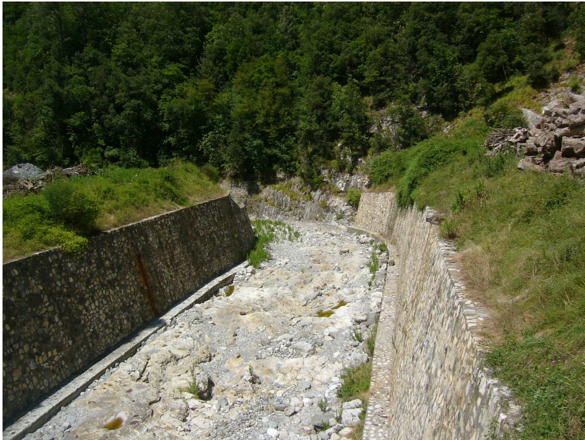
Foto 9 Vista ravvicinata alveo fluviale