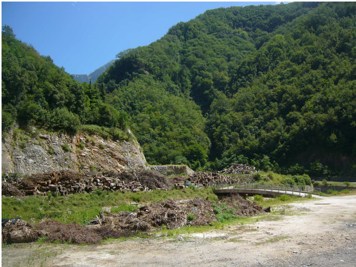
Foto 4 Vista dal piazzale interno